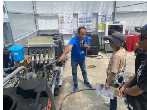
基隆市政府科長參觀隆笙溫室