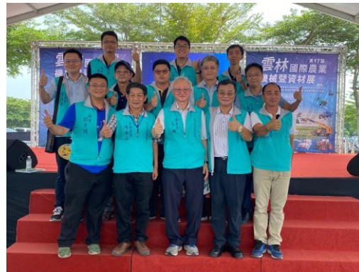
開幕儀式理監事合影