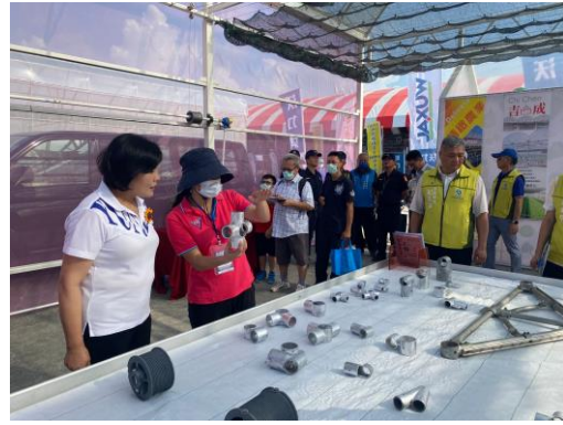
張縣長參觀吉成溫室