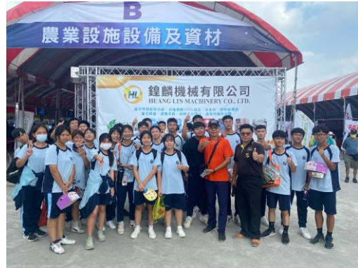
新社高中團體導覽