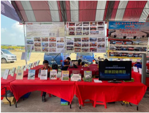
台灣農業設施協會攤位