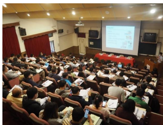
2020年新溫室技術交流研討會(第二場) 會場