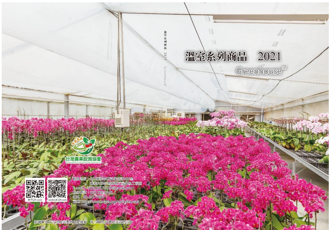
農業設施廠商產品目錄冊封面