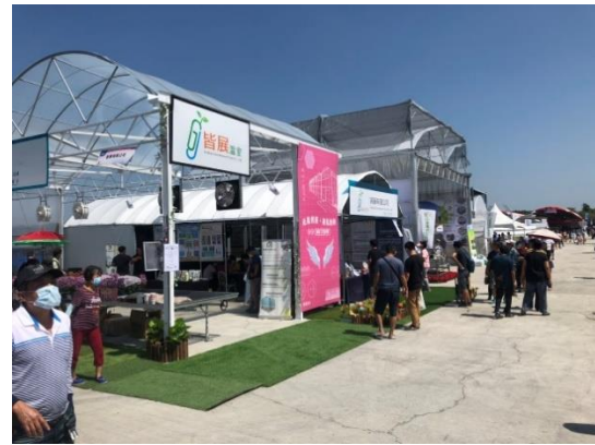
2020 第十五屆雲林國際農業機械暨資材展--農糧署指導及農業設施專區