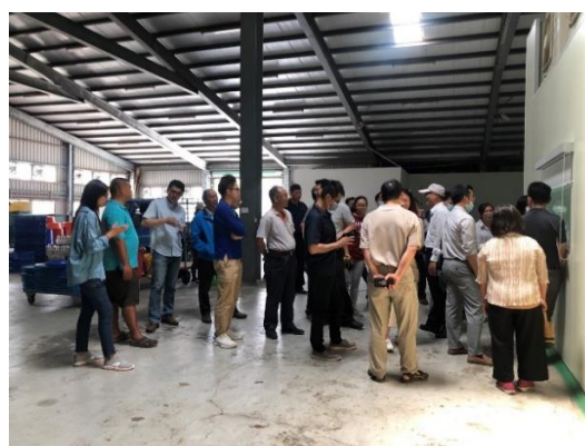
參訪雙鶴集團靈芝生技園區內智慧環控溫室--導覽靈芝菌種培育室