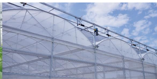
2020第15屆雲林國際農業機械暨資材展 2020 15 th Yunlin International Agricultural Machinery and Materials Exhibition