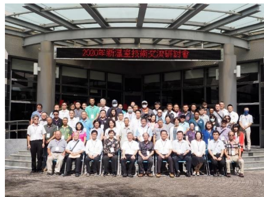
2020 年新溫室技術交流研討會(第一場)會場一隅及與會者大合照