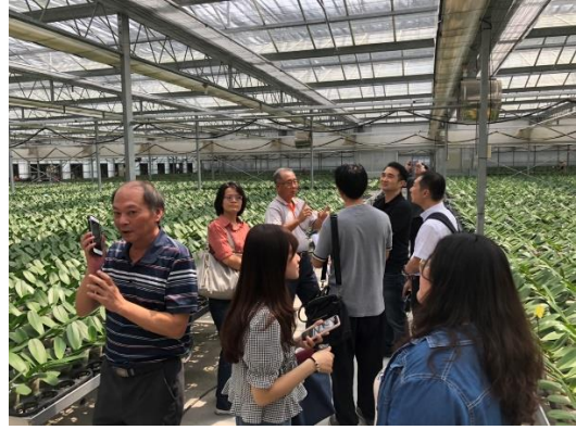
設施型農業五年計畫溫室訪查觀摩會人員合照及花王公司蘭花溫室